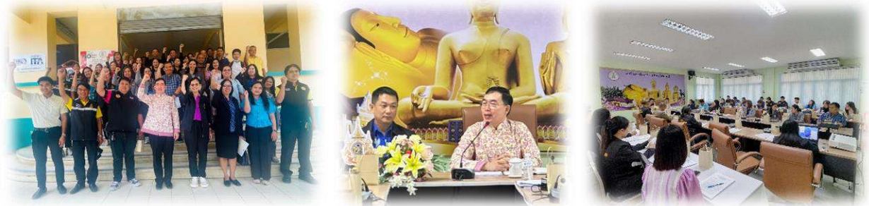
๖. อำเภอพรหมบุรี ประชุมเมื่อวันที่ ๒๘ มีนาคม ๒๕๖๘ เวลา ๐๙.๐๐ น. ณ ห้องประชุมโรงเรียนบ้านอำเภอเมืองสิงห์บุรี จังหวัดสิงห์บุรี มีผู้เข้าร่วมประชุม จำนวน ๔๖ คน