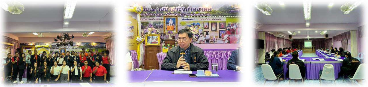
๔. อำเภออินทร์บุรี ประชุมเมื่อวันที่ ๒๐ มีนาคม ๒๕๖๘ เวลา ๑๓.๐๐ น. ณ ห้องประชุมโรงเรียนวัดโบสถ์(อินทร์บุรี) อำเภออินทร์บุรี จังหวัดสิงห์บุรี มีผู้เข้าร่วมประชุม จำนวน ๔๑ คน